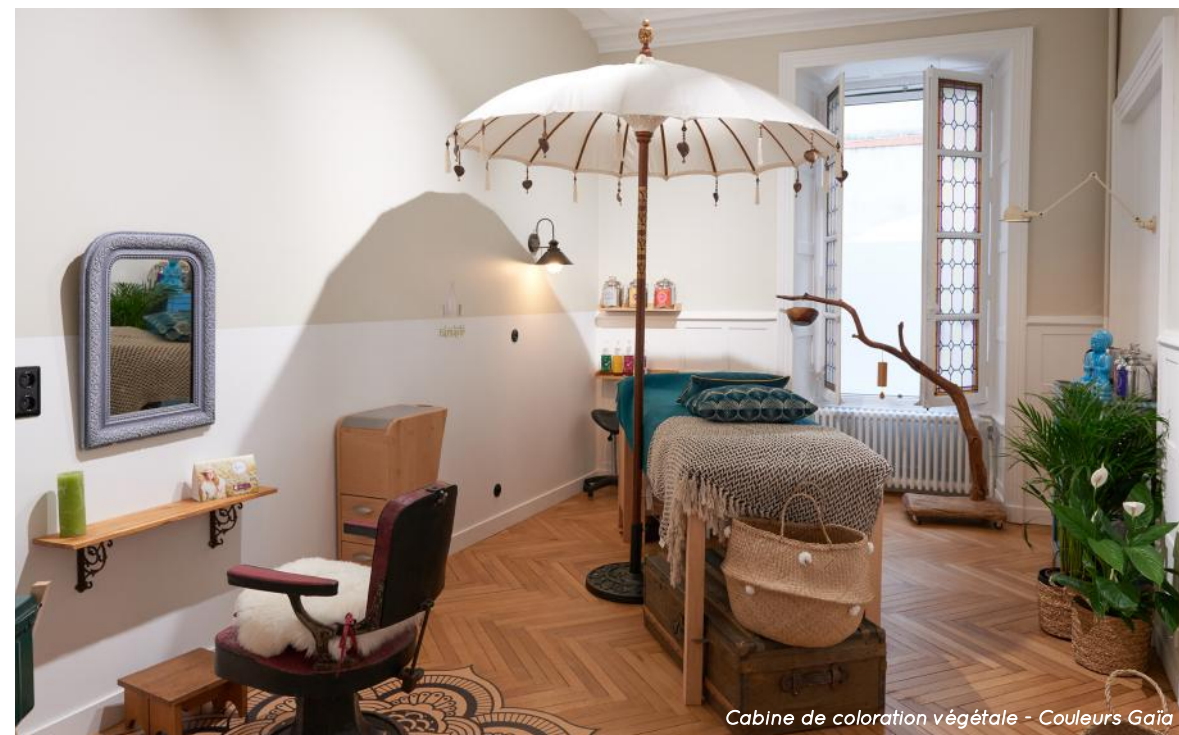
Cabine de coloration végétale - Couleurs Gaïa