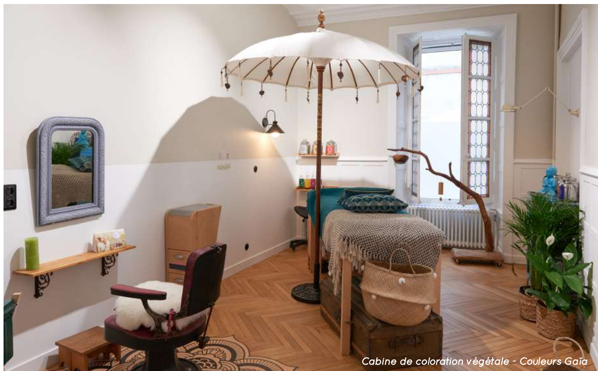
Cabine de coloration végétale - Couleurs Gaïa